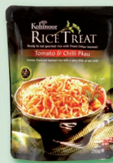
Kohinoor ryža Tomato + Chili hotové jedlo, 250 g (169,90)