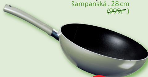
Essencia Wok panvica šampanská, 28 cm (999,-)