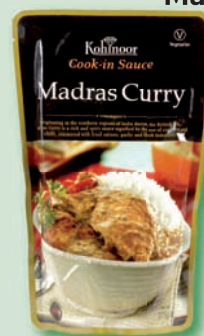
Kohinoor omáčka Madras Curry 375 g (169,90)