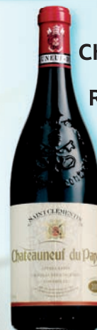
Chateaufeuf Du Pape Rouge Saint Clementin 0,75 l (499,-)