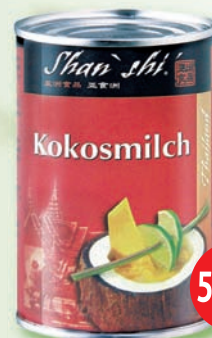
Kokosové mlieko 400 ml (71,90)