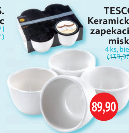
TESCO Keramické zapekacie misky 4 ks, biele (139,90)