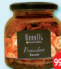
Bonelli pomodori secchi sušené rajčiny v snežnicovom oleji, 280 g (129,90)