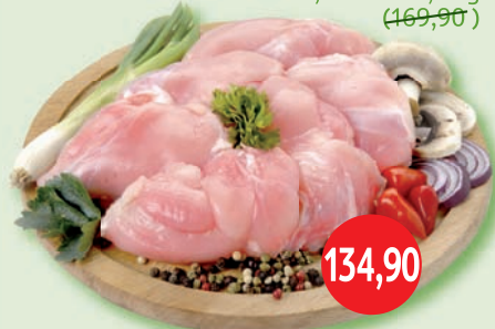
Kuracie stehno bez kosti a kože malé balenie, chladené, 1 kg (169,90)