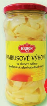
Bambusové výhonky 330 g (55,90)