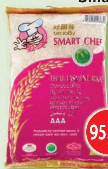
Ryža jazmínová Smart Chef 1 kg (119,90)