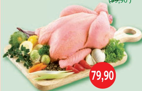
Sedliacke kurča chladené 1 kg (99,90)

Príprava: Kuracie stehná nakrojíme, aby sme čo najlepšie votreli tandori pastu a osolíme. Potom ich upečieme v rúre. Ryžu Basmati dôkladne prepláchneme a dáme dusiť do rúry. Hotové stehno podávame s ryžou Basmati. Olúpanú hrušku sparíme a po vychladnutí nakrájame na kocky a zmiešame s mango chutney, ktoré podávame ku kuraťu.