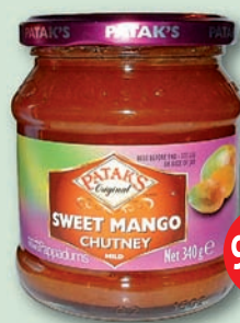
Sweet Mango Chutney 340 g (159,90)