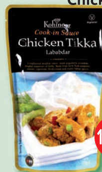
Kohinoor omáčka Chicken Tikka 375 g (169,90)