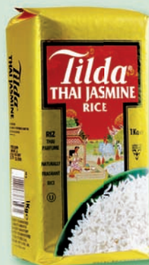
Ryža Tilda jazmínová 1 kg (129,90)