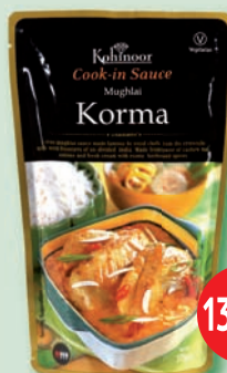
Kohinoor omáčka Korma 375 g (169,90)