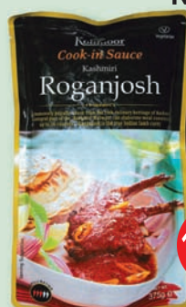
Kohinoor omáčka Roganjosh 375 g (169,90)