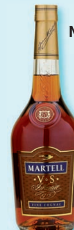
Martell V.S. Cognac 0,7 l (1199,-)