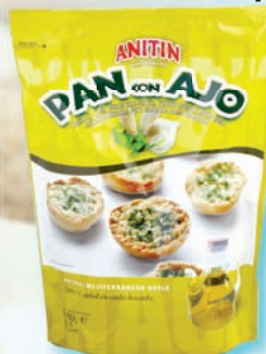
Krehký chlieb s cesnakom 150 g (55,90)