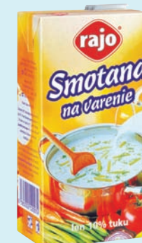
Smotana na varenie 500 ml (26,90)