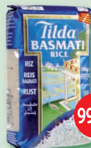
Ryža Tilda Basmati 500 g (125,90)