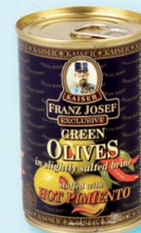
Olivy s papričkou Franz Josef 314 ml (29,90)