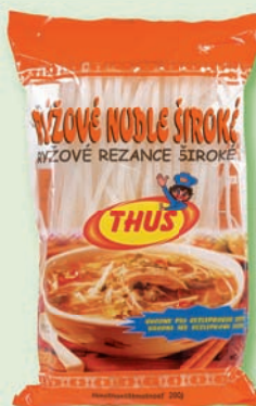
Ryžové rezance široké, 200 g (29,90)